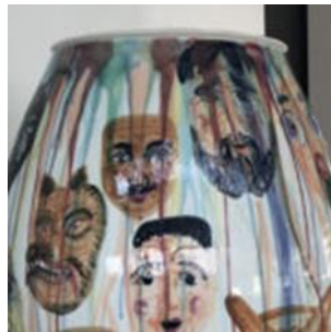
Quelques détails du vase...