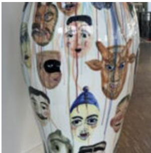
Le vase « Grand Charpin »