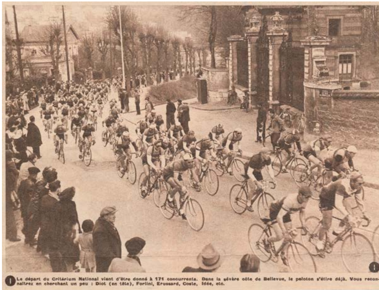
Photo du critérium national prise en 1940 ou 1942, 1943, 1945, 1947, 1948, 1949